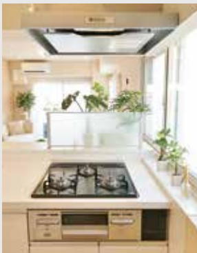
整流板付ステンレスレンジフード。ガスレンジはお手入れのしやすいホーロートップ3口コンロ。