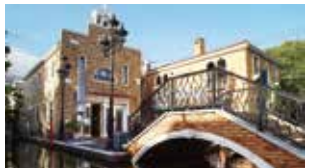
La Vita / ラ・ヴィータ 約700m 徒歩約9分