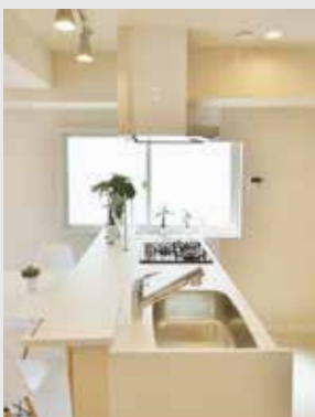
窓から光が差し込む明るいキッチン。