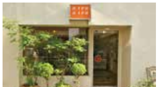
a-reu a-reu(美容室) 約40m 徒歩約1分