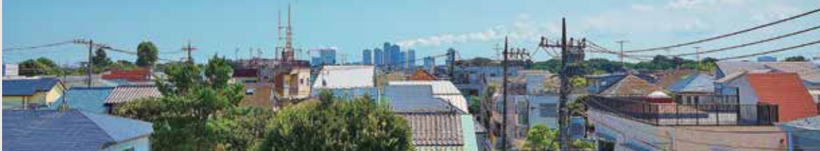
南面に広がる眺望。南面が第1種低層住居専用地域のため、高さ制限があります。(平成28年11月撮影 ※この眺望は将来に渡って保証されるものではありません。)