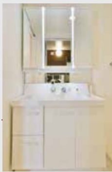
三面鏡収納付き洗面化粧台。ツールライン照明はデザインと機能性を満たしています。