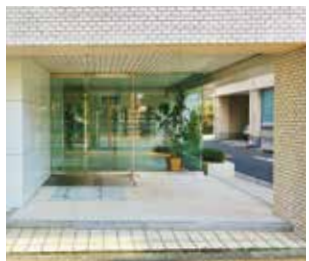
エントランス(正面入口)