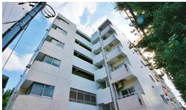
目黒通り沿いにそびえる高級ヴィンテージマンション