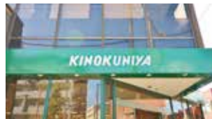
紀伊国屋 約270m 徒歩約4分

ショッピングやグルメに加えカルチャーも充実。自由が丘駅へ向かう途中のベニスを模した「La Vita」など、生活雑貨屋やスイーツ店、インテリアショップ、カフェが点在。毎日のお買い物も「THE GARDEN」や「紀伊国屋」が日常で使いこなせるステージです。