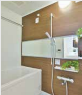
追い焚き機能・浴室乾燥機等を装備した1116サイズのユニットバス。ワイドミラーとエアインシャワーの最新設備です。